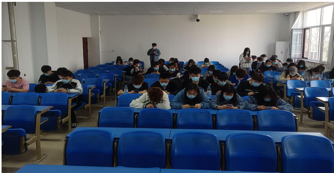
21 级造价 1 班干部组织同学们集体参加知识竞赛