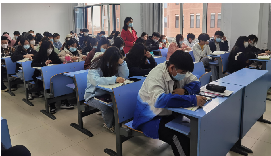
骆晓一老师课堂现场协助线上教学