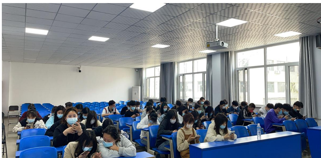
21 级造价 2 班同学们集体参加知识竞赛