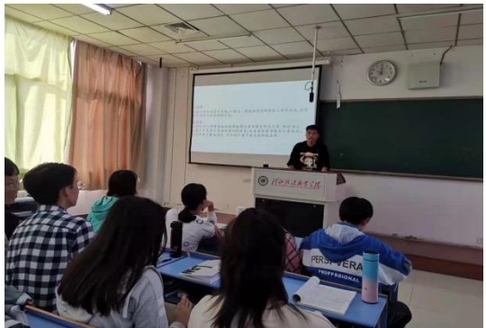
学生当“先生”讲课展示