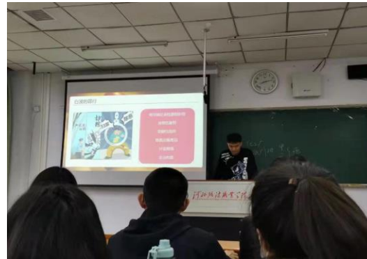
学生分组讨论、汇报