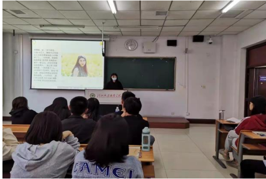
学生分享分析案例