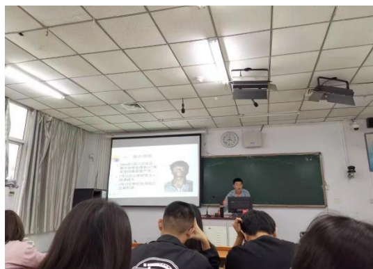
学生分享案例“于欢案”、“马加爵案”